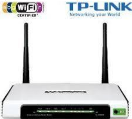
Modem adsl WI-FI 2.4 Ghz