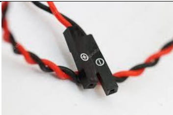
Cavetto Rosso/Nero per collegamento alimentazione 12 Volt dal telecomando all'alimentatore