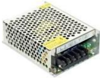
Alimentatore 2.5 A – 12 Volt