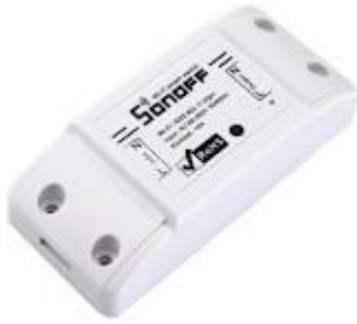
Sonoff Wi-Fi 2.4 Ghz