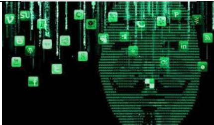
Connessione internet casa